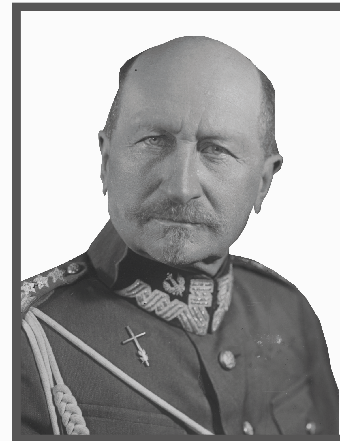
Józef Dowbor-Muśnicki – drugi naczelnny dowódca Powstania Wielkopolskiego.

Przyjazd Ignacego Paderewskiego do Poznania w grudniu miał być jedynie kolejną manifestacją polskości Prowincji Poznańskiej. Stał się jednak iskrą, która 27 grudnia doprowadziła do wybuchu powstania. Z ulic Poznania rozlało się ono najpierw na okoliczne miejscowości, a potem dalej, na cały region (dziś to tereny, które są w trzech województwach: kujawsko-pomorskim, wielkopolskim i lubuskim!). Ostatecznie uformowały się aż cztery fronty. Niektóre miasta i wsie zajmowano niemal bez rozlewu krwi, o inne toczono zacięte walki. Do najcięższych zmagania można zaliczyć boje o Szubin, Chodzież, Nakło, Inowrocław i Osieczną. Jednym z najważniejszych sukcesów było zdobycie lotniska we wsi Ławica w ciągu kilkunastominutowej akcji. Oddziały wielkopolskie miały przewagę nad przeciwnikiem dzięki brawurze, która niejednokrotnie równoważyła techniczną i liczebną przewagę żołnierzy niemieckich. Polscy żołnierze do ubrań przypinali srebrne orły i biało-czerwone kokardy, w najróżniejszych wersjach, wielkościach i materiałach. Na zapleczu Powstania Wielkopolskiego kobiety działały w służbach sanitarno-medycznych, organizacji żywienia, zaopatrzenia i wyposażenia, łączności i zwiadowstwa. Walki zakończył rozejm w Trewirze 16 lutego 1919 roku, a żołnierze uformowanej Armii Wielkopolskiej ruszyli na fronty innych walk o polskie granice. Włączona w granice II RP Wielkopolska wniosła znaczny wkład materialny i duchowy do odradzającego się państwa polskiego.