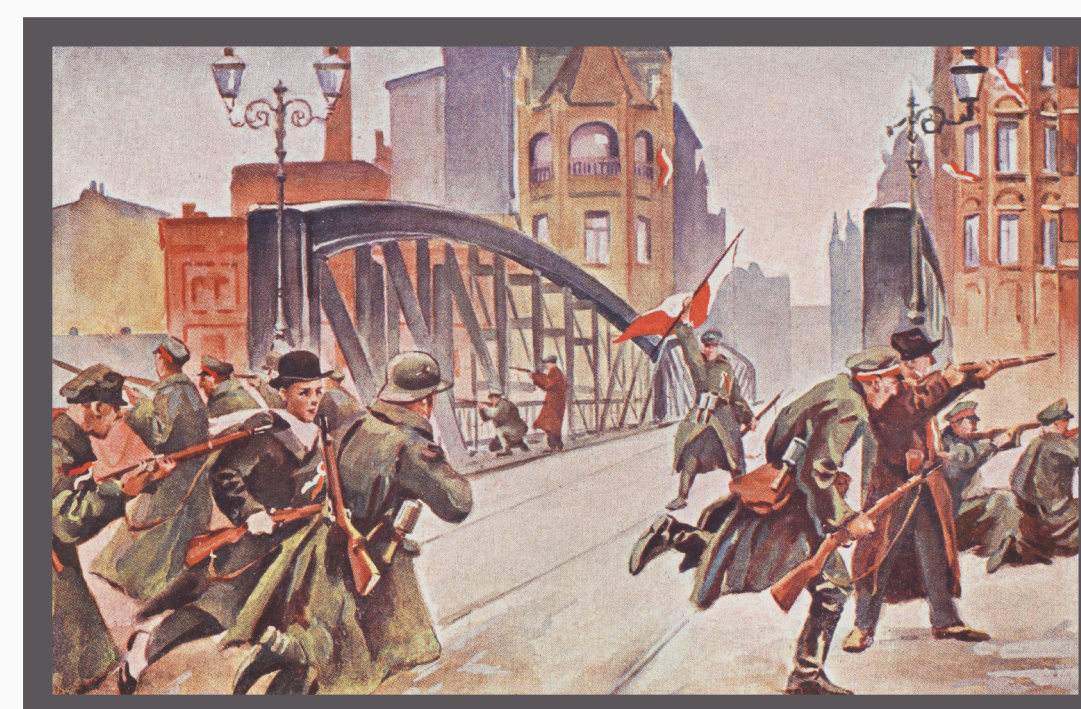
Pocztówki autorstwa Leona Prauzińskiego ze zbioru „Powstanie Wielkopolskie 1918/19”.

27.12.1918 – wybuchają pierwsze walki Powstania Wielkopolskiego w Poznaniu i w okolicy