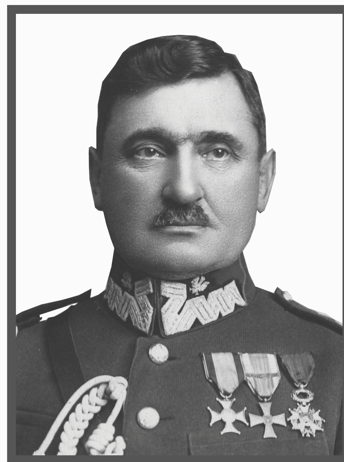
Stanisław Taczak – pierwszy naczelnym dowódcą Powstania Wielkopolskiego.

16.02.1919 – rozejm w Trewirze – Niemcy zobowiązani do zaprzestania działań przeciw Armii Wielkopolskiej