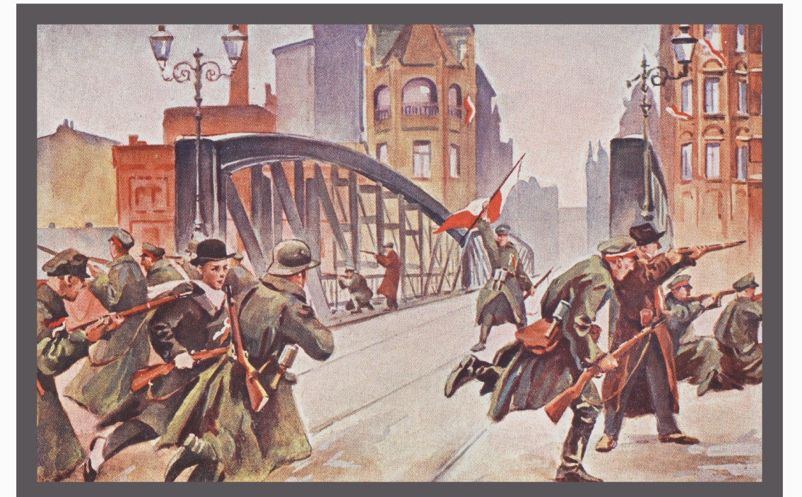
Pocztówki autorstwa Leona Prauzińskiego ze zbioru „Powstanie Wielkopolskie 1918/19”.

27.12.1918 – wybuchają pierwsze walki Powstania Wielkopolskiego w Poznaniu i w okolicy