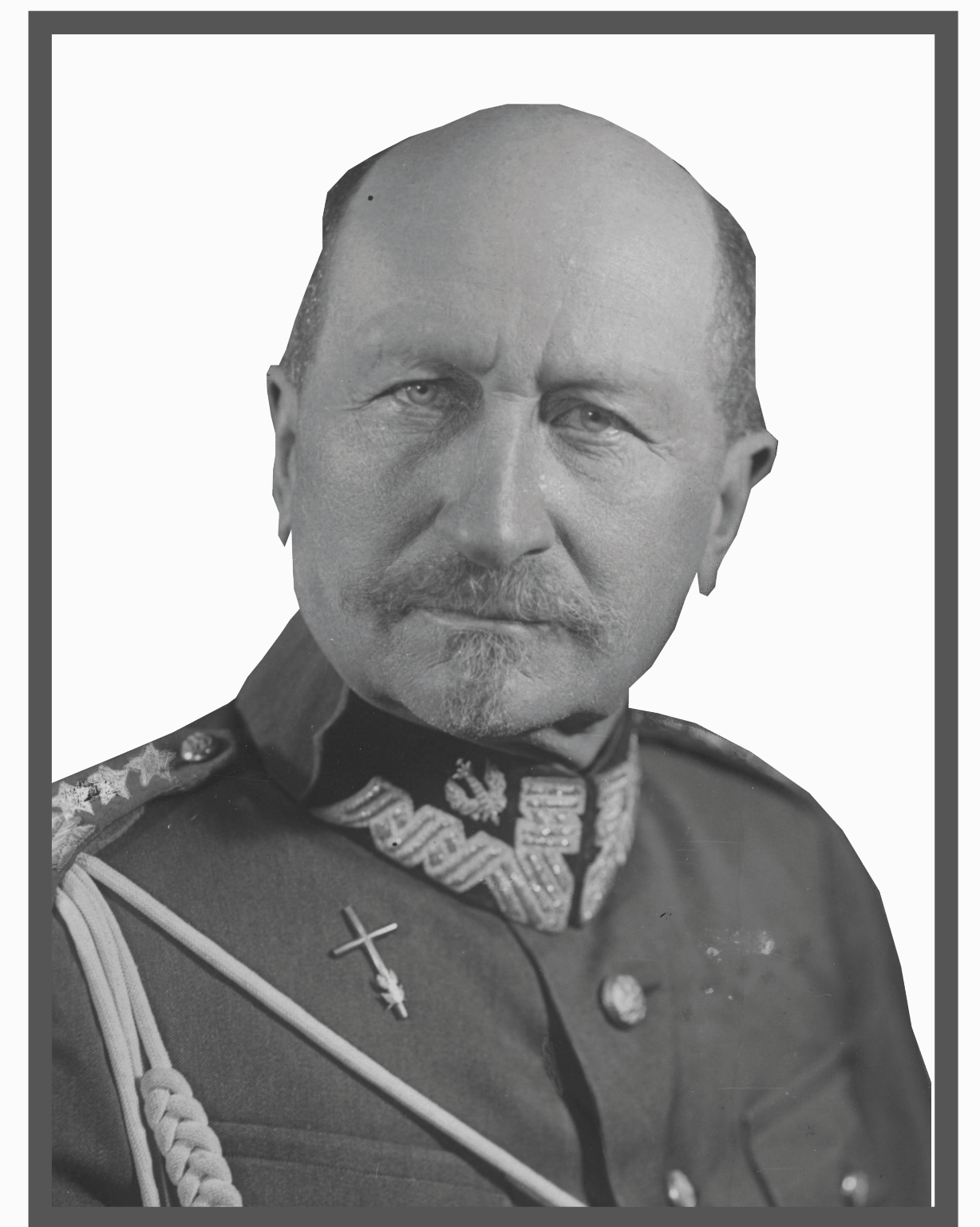
Józef Dowbor-Muśnicki – drugi naczelnym dowódcą Powstania Wielkopolskiego.

Przyjazd Ignacego Paderewskiego do Poznania w grudniu miał być jedynie kolejną manifestacją polskości Prowincji Poznańskiej. Stał się jednak iskrą, która 27 grudnia doprowadziła do wybuchu powstania. Z ulic Poznania rozlało się ono najpierw na okoliczne miejscowości, a potem dalej, nacały region (dziś to tereny, które są w trzech województwach: kujawsko-pomorskim, wielkopolskim i lubuskim!). Ostatecznie uformowały się aż cztery fronty. Niektóre miasta i wsie zajmowano niemal bez rozlewu krwi, o inne toczono zacięte walki. Do najcięższych zmagania można zaliczyć boje o Szubin, Chodzież, Nakło, Inowrocław i Osieczną. Jednym z najważniejszych sukcesów było zdobycie lotniska we wsi Ławica w ciągu kilkunastominutowej akcji. Oddziały wielkopolskie miały przewagę nad przeciwnikiem dzięki brawurze, która niejednokrotnie równoważyła techniczną i liczebną przewagę żołnierzy niemieckich. Polscy żołnierze do ubrań przypinali srebrne orły i biało-czerwone kokardy, w najróżniejszych wersjach, wielkościach i materiałach. Na zapleczu Powstania Wielkopolskiego kobiety działały w służbach sanitarno-medycznych, organizacji żywienia, zaopatrzenia i wyposażenia, łączności i zwiazdzie. Walki zakończył rozejm w Trewirze 16 lutego 1919 roku, a żołnierze uformowanej Armii Wielkopolskiej ruszyli na fronty innych walk o polskie granice. Włączona w granice II RP Wielkopolska wniosła znaczny wkład materialny i duchowy do odradzającego się państwa polskiego.