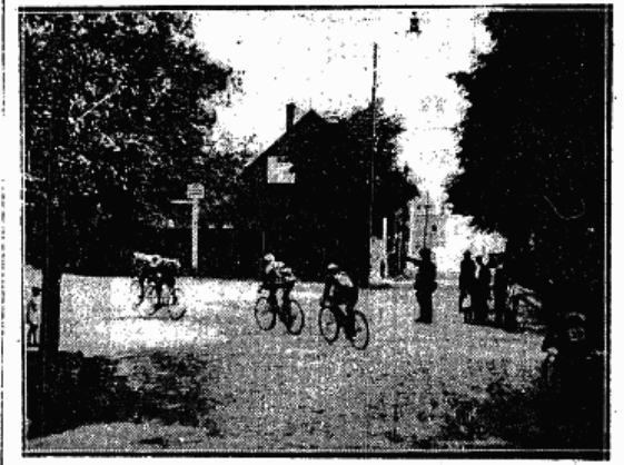
MIJAMY NOWE MIASTO gdzie zaszły znaczne zmiany w stawce czolowej Wyścigu do