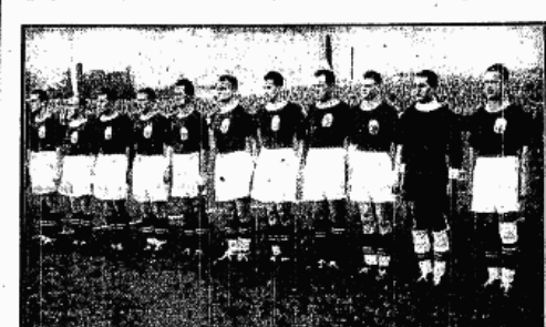
REPREZENTACJA ŁOTWY która ulegia Austrii 1:2 w Wiedniu, a potym Polsce B również 1:2 w Katowicach

Europy Podulecenie meczowe, gesta ciźba. denki wypadł na ring. " — Chlopie, uważal zgubileś swój blustkalter! Podczas waki ex-mistrza Europy wagi półśredniej Edera z Oldoinim,