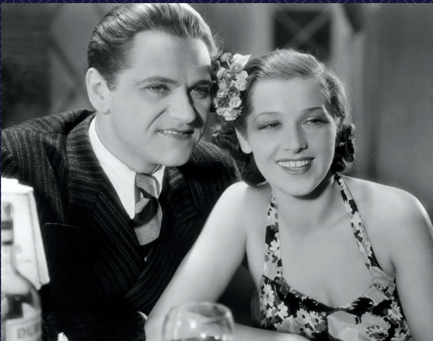
Eugeniusz Bodo i Helena Grossówna w scenie z filmu.

Paweł jest wynalazcą i właśnie skonstruował rewelacyjny model radioodbiornika, nie może jednak znaleźć nikogo, kto zainteresowałby się wynalazkiem. Znienawidzony przez niego sąsiad, Gaweł, jest sklepikarzem. Violetta jest skrzypaczką. Ma już dziewiętnaście lat, ale aby spłacić rodzinne długi, musi udawać obdarzone talentem muzycznym cudowne dziecko. Podczas jednego ze swych koncertów poznaje Pawła i zakochuje się w nim. On jednak nie zwraca uwagi na namolną smarkulę. Kiedy jednak Violetta, już jako atrakcyjna panienska, umawia się z Pawłem – ten traci dla niej głowę. Po licznych perypetiach udaje mu się przy pomocy Gaweła unieważnić dawne długi ukochanej. Teraz kiedy Violetta jest już wolna od wierzycieli, nic nie stoi na przeszkodzie jej szczęściu z Pawłem.