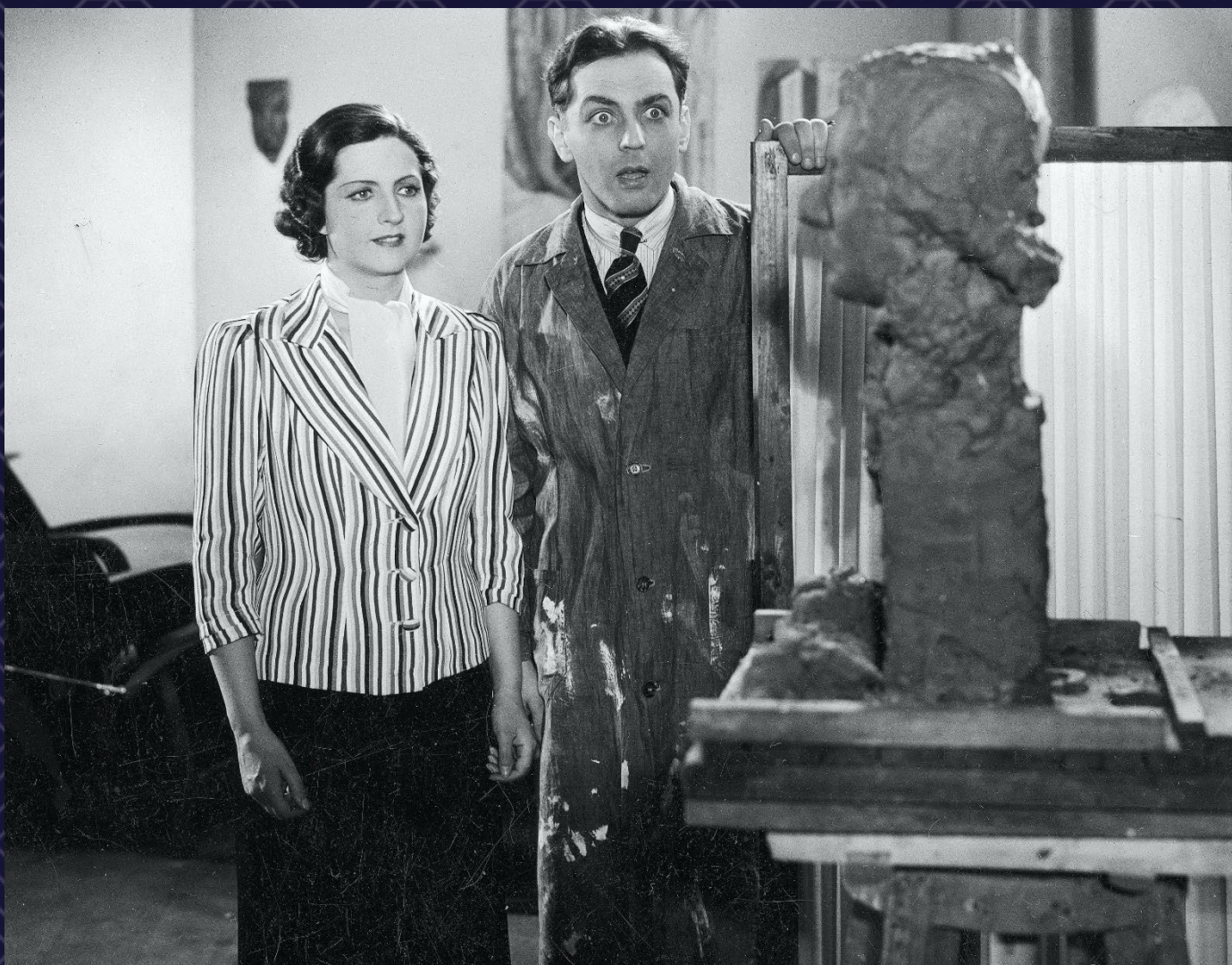
Jadwiga Smosarska i Aleksander Żabczyński w filmie „Jadzia”.

Prezesowa Oksza całą nadzieję pokłada w synu, który po powrocie z zagranicy ma postawić firmę na nogi. Jan udaje się do Jędruszewskiej, by nakłonić ją do korzystania ze swych raket. Spotyka tam Jadzię Maliczównę i przypadkowo bierze ją za znaną tenisistkę. Prosi ją o podpisanie deklaracji, że na najbliższym meczu zagra rakieta jego firmy. Jadzia podpisuje, jednak kiedy Jan dowiaduje się, że go oszukała, postanawia się zemścić i zgodnie z jej deklaracją wykorzystuje jej wizerunek do reklamy swojej firmy. Toczy się zażarta walka i jak to zwykle bywa – młodzi zakochują się w sobie. W końcu postanawiają połączyć swoje firmy.