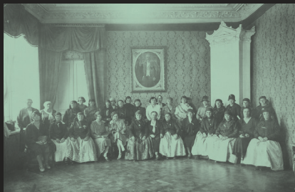
Zjazd Związku Pracy Obywatelskiej Kobiet w sali kasyna oficerskiego w Warszawie przy al. Suchoa, 1930 r.