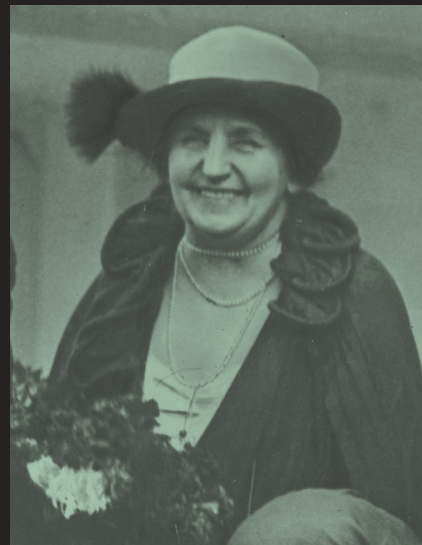
Helena Paderewska, 1927 r.

Pomagała ubogim artystom, wspierała światową organizację kobietą Young Women's Christian Association, zrzeszającą kobiety na całym świecie, była współzałożycielką Towarzystwa Pomocy dla Inteligencji, fundatorką szkoły dla dziewcząt w Julinie, a także honorowym członkiem Związku Polek w Ameryce.