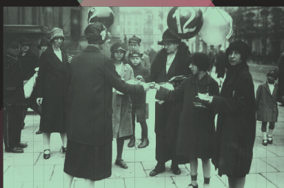
Kobiety agitujące na warszawskiej ulicy w dniu wyborów, 1927 r.