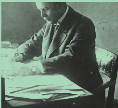
Wojciech Korfanty, 1928 r.