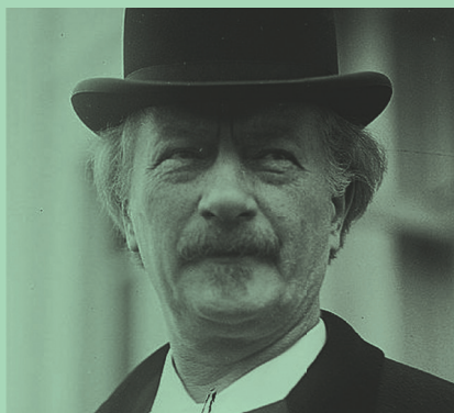
Premier Ignacy Paderewski, Narodowe Archiwum Cyfrowe