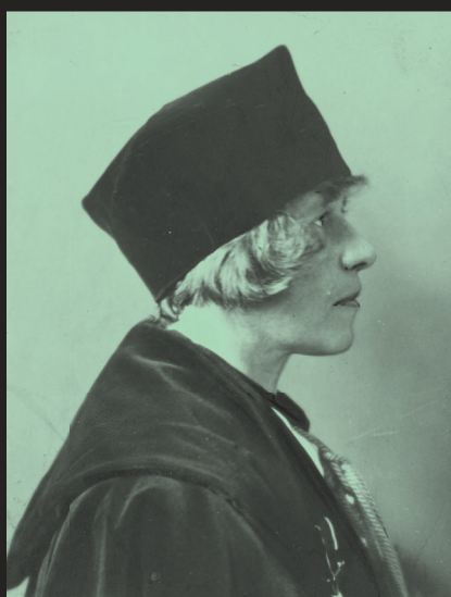
Cezaria Baudouin de Courtenay, etnolog, profesor Uniwersytetu Wileńskiego. Fotografia portretowa z profilu w uroczystym stroju akademickim

Choć żyła w czasach, gdy kobiety miały ograniczony dostęp do nauki, Cezaria Baudouin de Courtenay-Jędrzejewiczowa była jedną z najbardziej aktywnych kobiet naukowców dwudziestolecia międzywojennego.