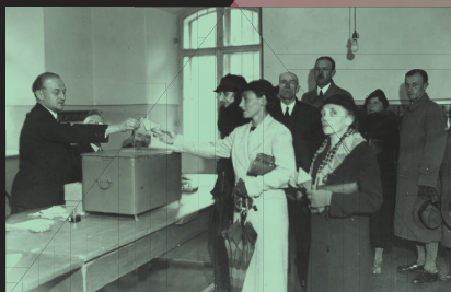
Mieszkancki Krakowa podczas głosowania, 1935 r.

Wiele dyskryminujących kobiety praw zniesiono w II Rzeczypospolitej. Zmianom ulegało prawo rodzinne i zasady sprawowania opieki nad dziećmi w rodzinach. Podjęto działania w kierunku sprawnego reagowania w przypadkach przemocy seksualnej i procederu handlu ludźmi. Poszerzano dostęp do opieki medycznej i wiedzę na temat higieny. Jednym z najważniejszych postulatów emancypantek był dostęp do edukacji. Zabiegano o zrównanie programów nauczania obu płci, a także rozbudowano szkolnictwo na wszystkich poziomach.