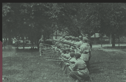
Oddział Ochotniczej Legii Kobiet, Warszawa, 1920 r.