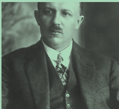
Kazimierz Bartel