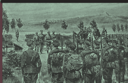
Wymarsz Pierwszej Kompanii Kadrowej z Oleandrów w Krakowie 6 sierpnia 1914 , pocztówka wg obrazu Jerzego Kossaka, Muzeum Wojska Polskiego w Warszawie