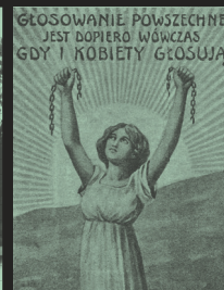
„Głosowanie powszechne jest dopiero wówczas gdy i kobiety głosują!”, [1907–1918 r.]