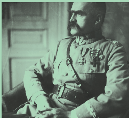
Józef Piłsudski, 1921–1930 r.