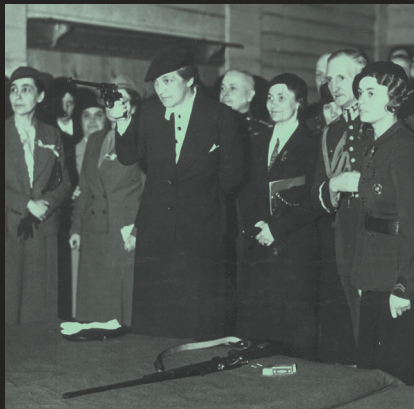
Aleksandra Piłsudska strzela z rewolweru do tarczy. Na stole leży karabinek sportowy wz. 30 i paczka naboju, 1937 r.

Historia II Rzeczypospolitej to historia ludzi, którzy za swoją powinność uważali budowę silnego państwa, ramię w ramię walczyli o jego wolność, a następnie świadomie pracowali na różnych polach, wykazując się odpowiedzialnością i troską o swój kraj. Realne zmiany stały się świadectwem ich skuteczności.