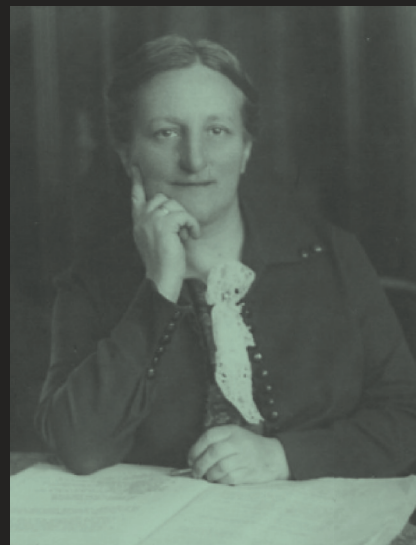
Zofia Moraczewska, 1935 r.

Zofia Moraczewska weszła w skład Sejmu Ustawodawczego jako jedyna kobieta z ramienia klubu Związku Polskich Posłów Socjalistycznych. Była również pierwszą kobietą w historii Polski przemawiającą z mównicy sejmowej. Z jej inicjatywy w 1928 r. Demokratyczny Komitet Wyborczy Kobiet Polskich przekształcony został w Związek Pracy Obywatelskiej Kobiet, który szybko stał się największą organizacją kobiecą w kraju. Dwa lata później ponownie wybrano ją do Sejmu z listy państwowej Bezpartyjnego Bloku Współpracy z Rządem. Pełniła wtedy rolę kierownika grupy w Komisji Imigracyjnej.