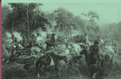
Bitwa pod Ignacem , Juliusz Kossak. Zwycięska dla powstańców bitwa stoczona w czasie powstania styczniowego, Muzeum Narodowe w Warszawie