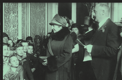
Michalina Mościcka wśród dzieci szkolnych, 1926 r.