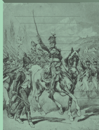
Marsz, marsz Dąbrowski!, Juliusz Kossak. Generał Jan Henryk Dąbrowski wskazuje drogę żołnierzom; akwarela nawiązuje do słów Hymnu Polskiego

historii. Jedni za pomocą broni, inni za pomocą słowa – walczyli, aby pamięć o Polsce trwała, aby kwestia polska nieustannie powracała na arenę międzynarodową, a sami Polacy nie utracili swojej tożsamości. Zrzucenie jarzma niewoli i wywalczenie niepodległości było możliwe dzięki codziennej aktywności i systematycznej, konsekwentnej pracy często nieznanych lub zapomnianych bohaterów walki o niepodległość.