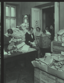
Członkinie Białego Krzyża przygotowują paczki dla polskich żołnierzy na froncie, Warszawa, 1920 r.