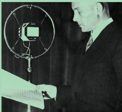
Premier Janusz Jędrzejewicz przed mikrofonem, 1933 r.