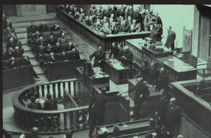
Głosowanie w sejmie, widoczna jedna z posłanek, 1938 r.

Przez cały okres trwania II Rzeczypospolitej w parlamencie zasiady 32 posłanki i 18 senatorek. Polki, jako świadome uczestniczki życia politycznego i społecznego, pojawiały się też we władzach niższego szczebla, takich jak rady gmin i miast. Przyznanie czynnego i biernego prawa wyborczego Polkom nie spotkało się z większym sprzeciwem społecznym, było zwieńczeniem ich zasług w walce o niepodległość Polski.