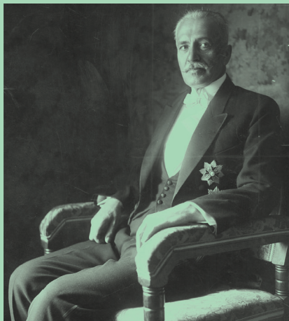
Prezydent Ignacy Mościcki