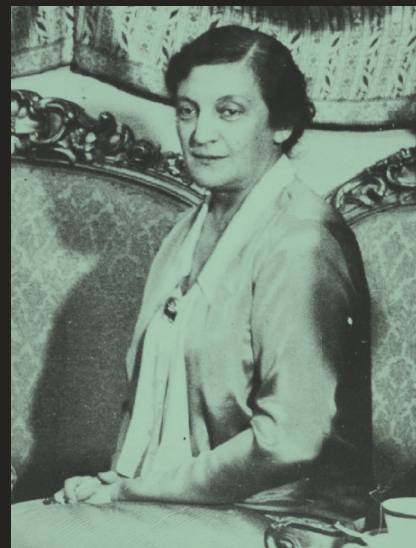
Aleksandra Piłsudska, [1930 r.]

W 1906 r. Szczerbińska poznała Józefa Piłsudskiego, który już wówczas uznawany był za konspiracyjną legendę, i związała się z nim rok później. Po narodzinach córek Wandy (ur. 7 II 1918) i Jadwigi (ur. 28 II 1920) Aleksandra nie zaprzestała swojej aktywności. Po ślubie w 1921 r. Pierwsza Dama Niepodległej prowadziła jednak głównie szeroką działalność honorową i społeczną.