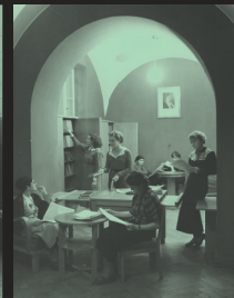
Studentki w bibliotece, 1936 r.