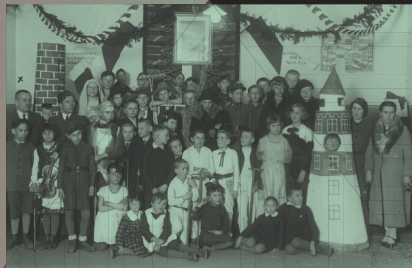
Uczniowie Szkoły Powszechnej im. Władysława Jagiełły w Chrzanowie, 1935 r.