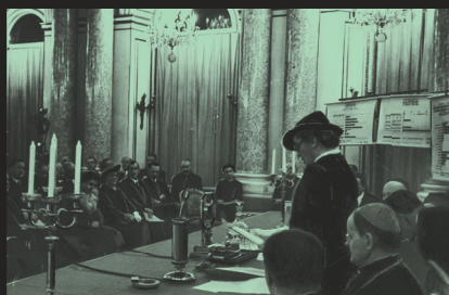
Uczestnicy posiedzenia słuchają sprawozdania odczytywanego przez Aleksandrę Piłsudską, 1938 r.