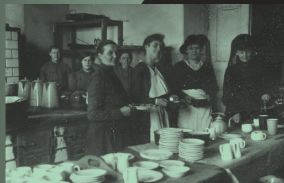
Przygotowywanie posiłku przez członkinie organizacji kobiecych w Gospodzie Żołnierskiej, Wojskowe Biuro Historyczne