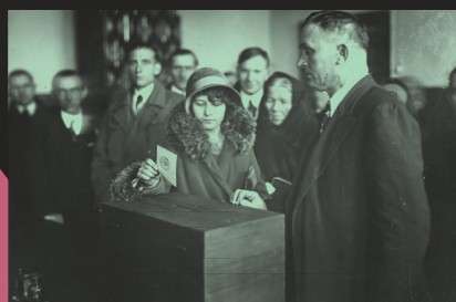
Mieszkanca Borka Fałęckiego podczas głosowania, Kraków, 1930 r.