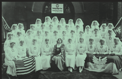
Siostry Polskiego Białego Krzyża wraz z Heleną Paderewską, 1918 r.