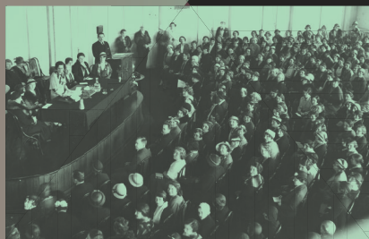
Zjazd walny warszawskiego Związku Pracy Obywatelskiej Kobiet, 1933 r.