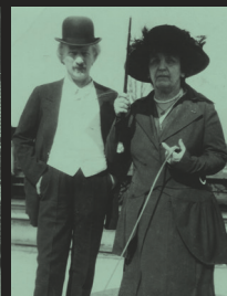
Helena i Ignacy Paderewscy, The Polish Museum of America