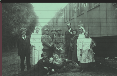
III powstanie śląskie, powstańcy pociąg sanitarny nr 3, 1921 r., Narodowe Archiwum Cyfrowe