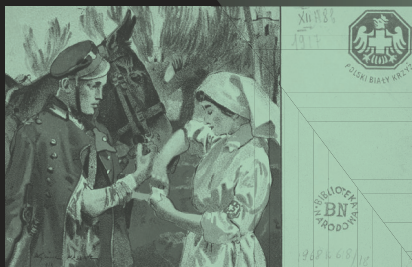
Polski Biały Krzyż, karta pocztowa na podstawie obrazu Wojciecha Kossaka, [po 1919 r.]

Czerwonego Krzyża (przemianowane w 1927 r. na Polski Czerwony Krzyż) czy Caritas. Ważną rolę odegrał Polski Biały Krzyż (Polska przed odzyskaniem niepodległości nie mogła powołać swojego oddziału PCK), który udzielał pomocy żołnierzom i otaczał opieką ich rodziny. Symbolem pomocy niesionej przez PBK były lalki szmacianki, autorstwa polskich artystów przebywających we Francji na przymusowej emigracji. Najpopularniejszymi lalkami były ogrodnik Jaś i jego przyjaciółka Halka, ochrzczone tak prawdopodobnie ku czci Heleny i Ignacego Jana Paderewskich.