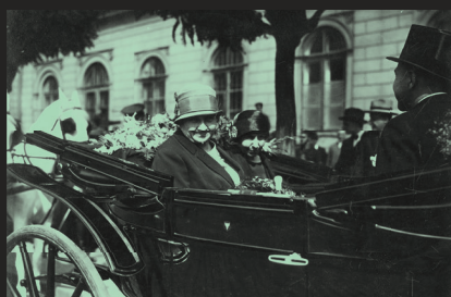
Przyjazd Michaliny Mościckiej do Warszawy, 1926 r.