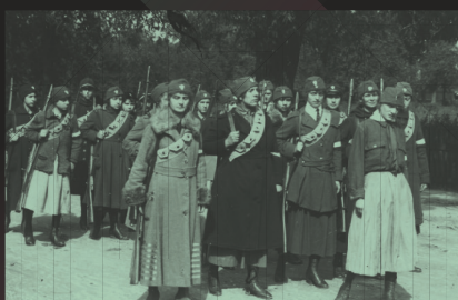
Ćwiczenia oddziału Ochotniczej Legii Kobiet, Warszawa, 1920 r., Wojskowe Biuro Historyczne

W tym czasie doszło do przełamania stereotypu dotyczącego bezpośredniego udziału kobiet w walce. Od 1911 r. mogły one wstępować do Związku Strzeleckiego. Początkowo brały udział w szkoleniach wojskowych, gromadzeniu broni oraz w pracach wywiadowczych. W czasie wojny były sanitariuszkami, kurierkami, instruktorkami, ale też konstruktorkami bomb. Przemycaly broń pod spódnicami i brały bezpośredni udział w akcjach zbrojnych.