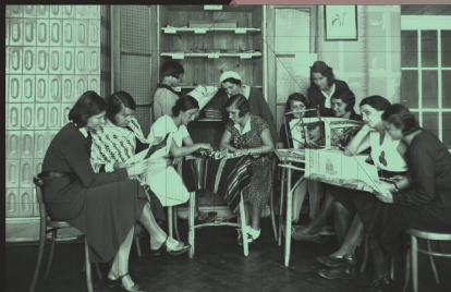
Studentki grające w szachy i przeglądające prasę, 1932 r., Narodowe Archiwum Cyfrowe

Z upowszechnienia szkolnictwa korzystały szczególnie dziewczęta. Mogły one uczęszczać do szkół wszystkich szczebli. Widoczne to było zwłaszcza na wyższych uczelniach. I pomimo dysproporcji pomiędzy studiującymi kobietami i mężczyznami o sukcesie polskiego szkolnictwa może świadczyć fakt, że 28% studentów krajowych szkół wyższych stanowiły kobiety. Wynik ten plasował Polskę w europejskiej czołówce.