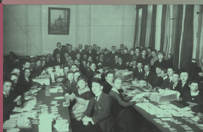
Plebiscyt na Śląsku, sporządzanie list głosujących i kart do głosowania, 1921 r.

W jednym i drugim wypadku relacje w początkowym okresie budowania polskiej państwowości przybrały formę konfliktów militarnych. Wyjątkowym przykładem była kwestia przynależności państwowej Górnego Śląska. Problem narodowościowy eskalował w postaci zbrojnych powstań wymierzonych przeciwko ustaleniom plebiscytowym i przynależności tego obszaru do Niemiec. Otwarty konflikt zbrojny zakończyło ustalenie granicy 12 października 1921 r. Polityczny i historyczny sukces Polski (jedna trzecia spornego obszaru, w tym ponad 50% hutnictwa i 79% kopalń węgla, przypadła stronie polskiej) był w dużej mierze zasługą wybitnego przywódcy i stratega Wojciecha Korfa.