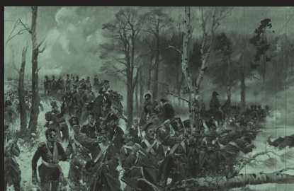
Olszynka Grochowska , Wojciech Kossak. Największa bitwa powstania listopadowego, Muzeum Narodowe w Warszawie