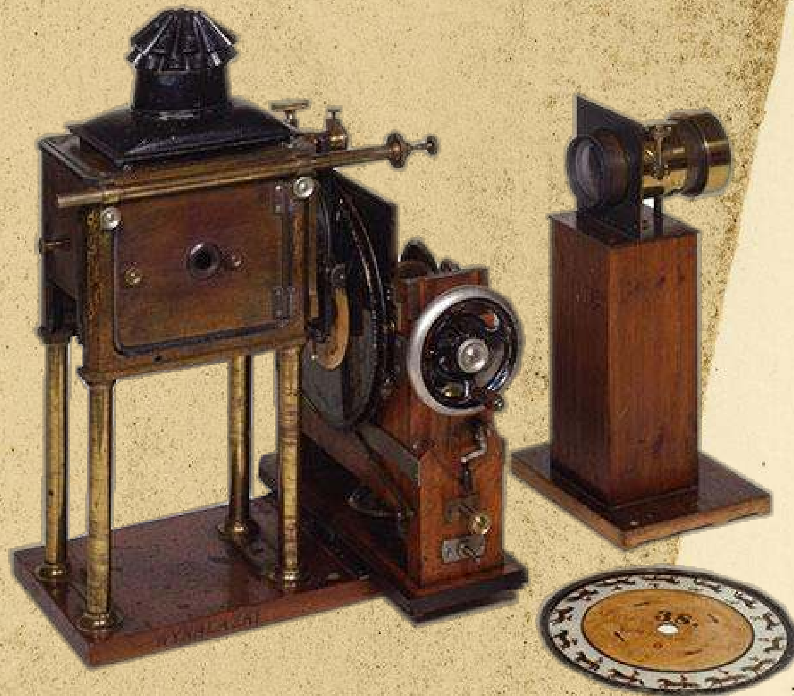
Załącznik nr 10. Zoopraksiskop